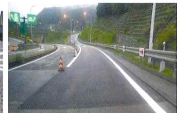
舗装補修完了イメージ