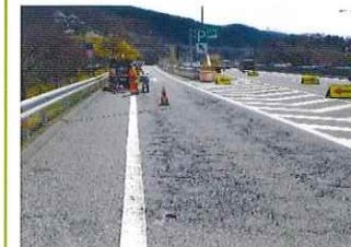
舗装損傷状況 現状

安全・快適に高速道路をご利用いただくために必要な工事ですので、ご理解とご協力をお願いいたします。